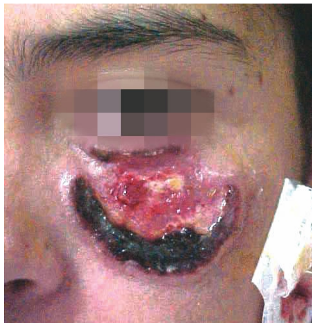
Figura 1. Imagen cercana de la lesión a estudio

Los resultados de hemograma, velocidad de sedimentación globular, glicemia, examen de orina, nitrógeno ureico,